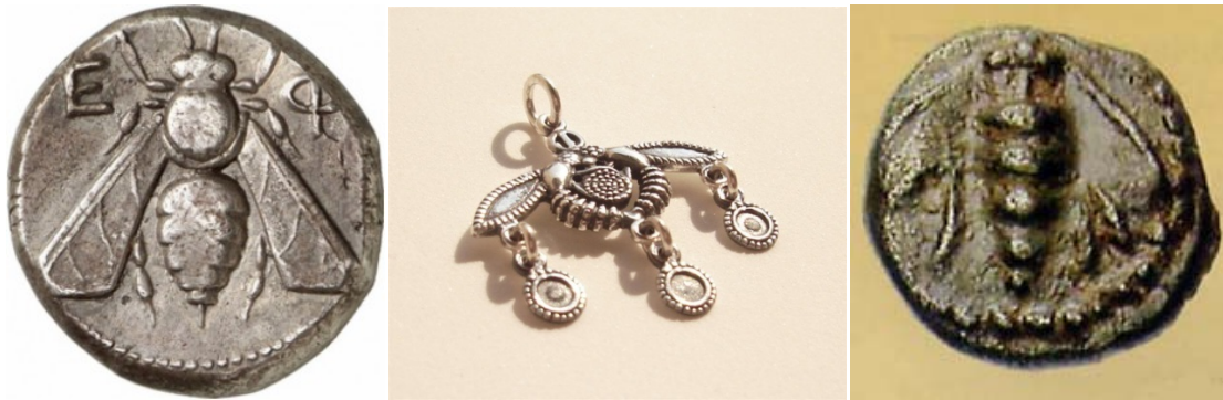
Foto nr.4 Monedha dhe stoli me figurë të bletës

Monedhat e qytetit të Butrintit që i takojnë periudhës (168 p.k – 395 pas k.), pos figurave të tjera përmbajnë edhe figura të bletës dhe koshereve të bletëve ( foto nr.4 ).