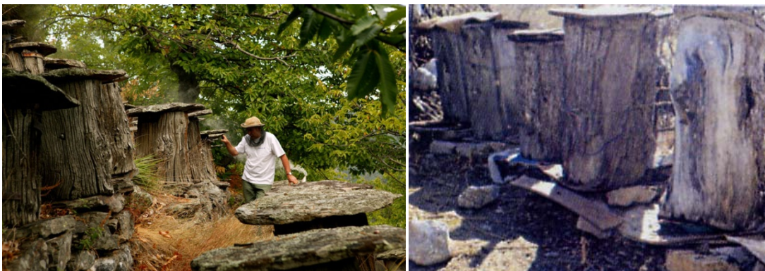
Foto nr.6 Zgjoje primitive

Sikurse në tërë botën edhe në trojet shqiptare, deri në shekullin e XX, bletët janë kultivuar në zgjoje trugjesh të bimëve drunërore të gdhendura nga brenda, (foto nr 6)